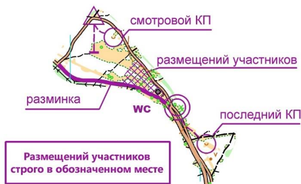
Схема арены соревнований

Ограничивающие ориентиры: север – железная дорога, восток – река Харинка, юг – асфальтовая дорога, запад – гаражные кооперативы, 41 школа. Аварийный азимут - 270°.